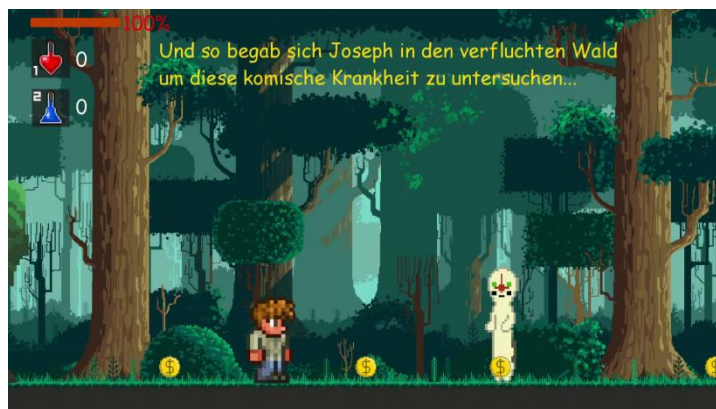
Start des ersten Levels